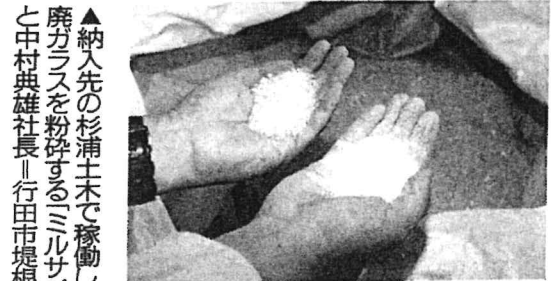
ミルサイザーで大きさの異なる粒に砕かれたガラス